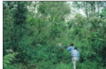
Les «touristes nature» doivent avoir accès non seulement au monde spectaculaire de la faune, mais également à d'autres merveilles de la nature.

Depuis le milieu des années 70, des touristes vont observer les gorilles des montagnes. Étant donné que ce tourisme dégage des revenus considérables (actuellement US$ 250 par touriste), de plus en plus de gorilles s'habituent à la présence de l'Homme: près de la moitié de l'ensemble du cheptel en 1997 (17 groupes). Les gorilles de plaine occidentaux seront également accessibles avec le projet de tourisme financé par l'UE.