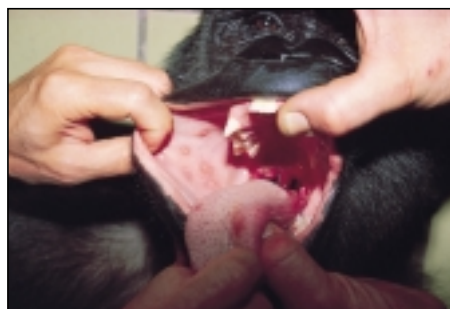
Amygdalite (en haut) et blanchet (en bas) chez un gorille - Deux cas de contamination par l'Homme.