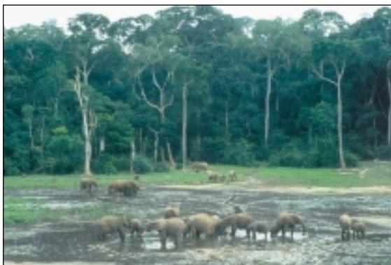
Eléphants des forêts dans une clairière de la forêt tropicale d'Afrique centrale.

Les éléphants des forêts consomment quelque 140 espèces végétales différentes et sont le plus important, voire l'unique propagateur de graines pour un tiers des espèces d'arbres. Ils se nourrissent principalement de gros fruits à enveloppe dure, dont les noyaux passent dans l'intestin sans être endommagés, acquérant au passage leur pouvoir germinatif. Le rejet des noyaux dans les excréments, généralement à une distance importante de l'arbre d'origine, contribue considérablement à la dispersion des plantes . Il est probable que l'expansion de la forêt après l'époque glaciaire soit en grande partie l'œuvre des éléphants.