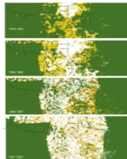
L'importance des régions protégées pour le maintien de la biodiversité est particulièrement vraie en Afrique occidentale où moins de 8% des forêts datant d'après l'époque glaciaire sont conservées. En Côte d'Ivoire, la quasi-totalité de la forêt tropicale a disparu et même le Parc National Taï a accusé un net recul au cours des dernières décennies. Ces forêts constituent le dernier refuge pour les espèces animales dépendantes de ce milieu naturel.

Les vastes étendues de forêts du bassin du Congo se partagent entre la RD Congo, le Gabon, le Cameroun, la RP Congo, le sud de la RCA et le centre de la Guinée-Equatoriale. A l'époque glaciaire, ces forêts, les plus anciennes forêts tropicales d'Afrique, constituaient les derniers refuges. Ce fut également le point de départ du repeuplement du continent par les plantes et les animaux.