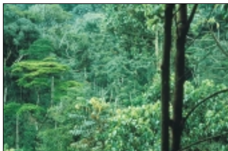
La structure étagée de la forêt tropicale recèle une multitude de refuges pour de nombreuses espèces.

Après la forêt amazonienne en Amérique du Sud, le bassin du Congo représente, en superficie, la deuxième forêt tropicale de la planète. Sur les 6,8 millions de km 2 de forêt qui couvraient autrefois la région, il ne reste plus aujourd'hui que 2 millions de km 2 , soit 70% de la forêt tropicale du continent africain. Elle abrite la moitié des espèces animales africaines. 80% des plantes à fleurs connues dans le monde poussent exclusivement dans cette région.