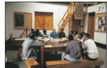
Les ateliers transmettent des connaissances sur les stratégies de protection de la nature.