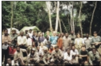
La collaboration internationale (ici l'équipe chargée du recensement des grande mammifères dans le Parc National de Kahuzi-Biega) requiert de la compréhension et permet de faire progresser les projets.