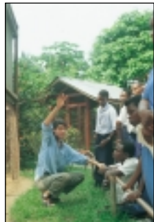
Sensibilisation à l'environnement dans l'orphelinat Drill-Ranch/Nigeria.

Le „développement durable“ (= aspiration commune au bien-être économique, à l'égalité sociale et à la préservation des conditions de vie naturelles) était déjà une exigence de l'UICN en 1980 et, en 1987 et 1992 (agenda 21), il était à nouveau préconisé par la conférence des Nations Unies sur l'Environnement et le Développement. En 1996 toutefois, l'UICN a décrit les projets en cours, notamment ceux qui concernent l'utilisation durable: ils sont influencés à différents niveaux sur le plan économique, imprévisibles et souvent préjudiciables à la nature.